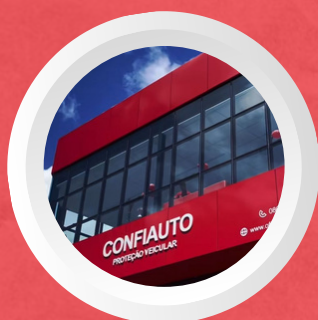
Serra/ES Av. central laranjeiras. serra.