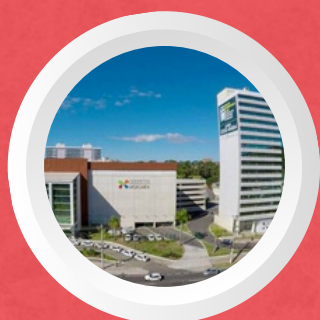
Cariacica/ES Av. Mário Curgel São Francisco, Cariacica.