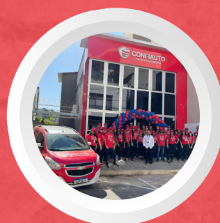
Cachoeiro/ES rua brahim antonio seder centro. cachoeiro de itapemirim.